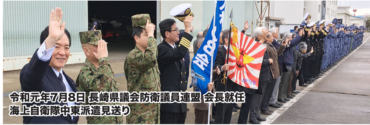
令和元年7月8日 長崎県議会防衛議員連盟 会長就任 海上自衛隊中東派遣見送り