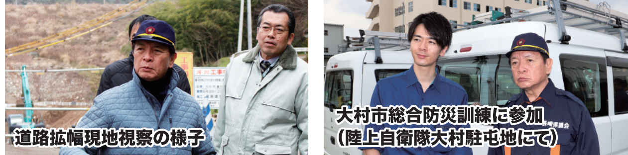
道路拡幅現地視察の様子 大村市総合防災訓練に参加 (陸上自衛隊大村駐屯地にて)