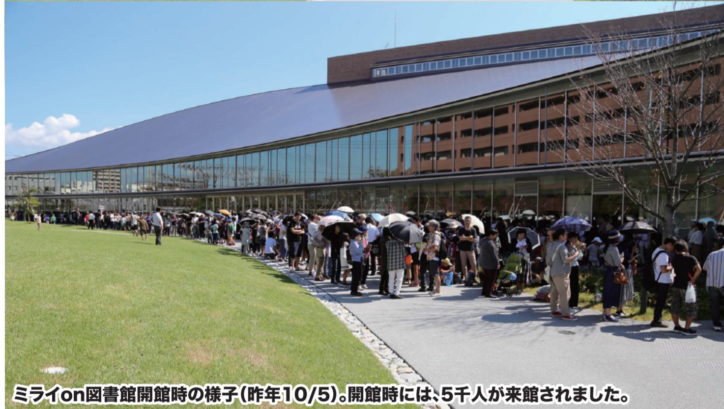
ミライon図書館開館時の様子(昨年10/5)。開館時には、5千人が来館されました。