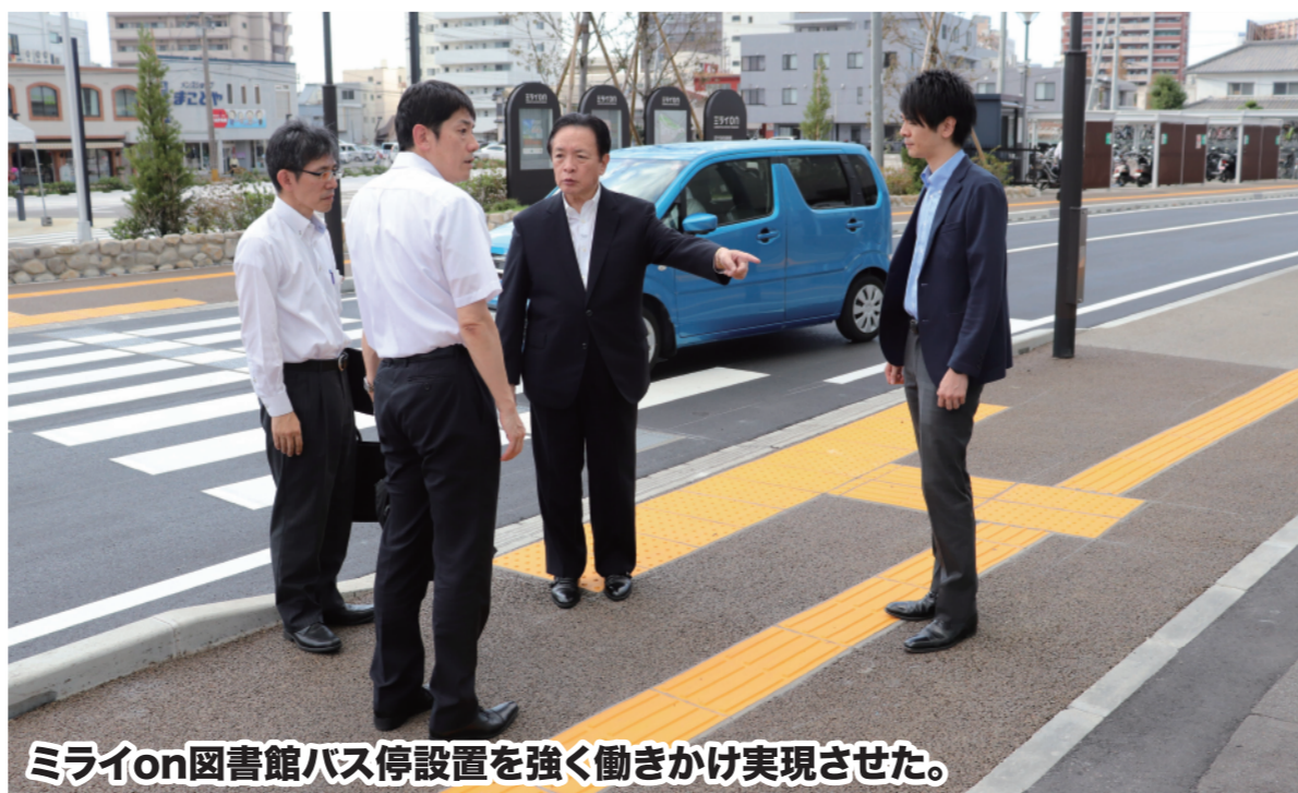
ミライon図書館バス停設置を強く働きかけ実現させた。

この協力貸し出しについては、利用者の利便性を高めるため、自宅のインターネットから資料の申し込みを可能にする「インターネット協力貸し出し」のシステムを現在構築しているところであり、今後、市町立図書館の協力を得ながら、広域的なサービスの充実に取り組んでまいりたい。